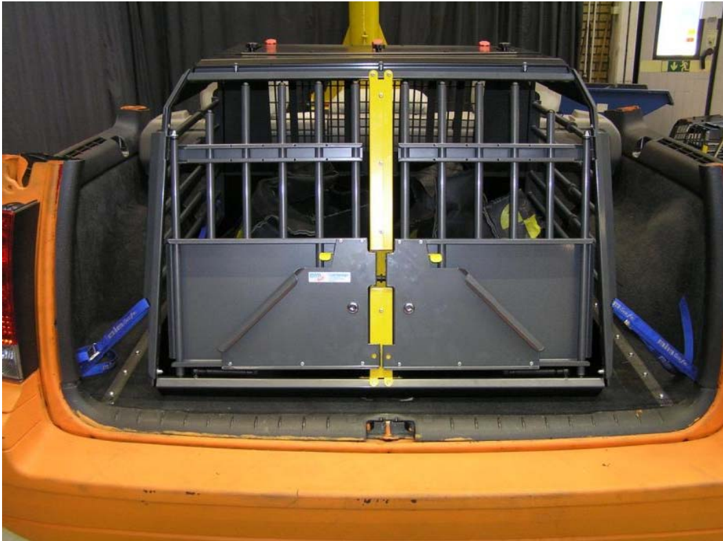
Bild 1, Setup frontalt krockprov