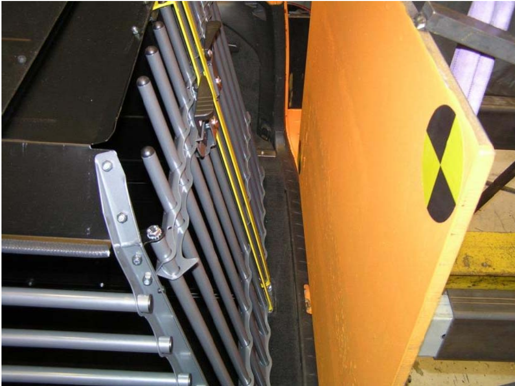
Bild 3, Krockbarriärens position när krockjärnen börjar deformeras