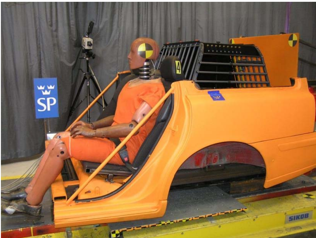
Bild 2, Setup upphinnandeprov