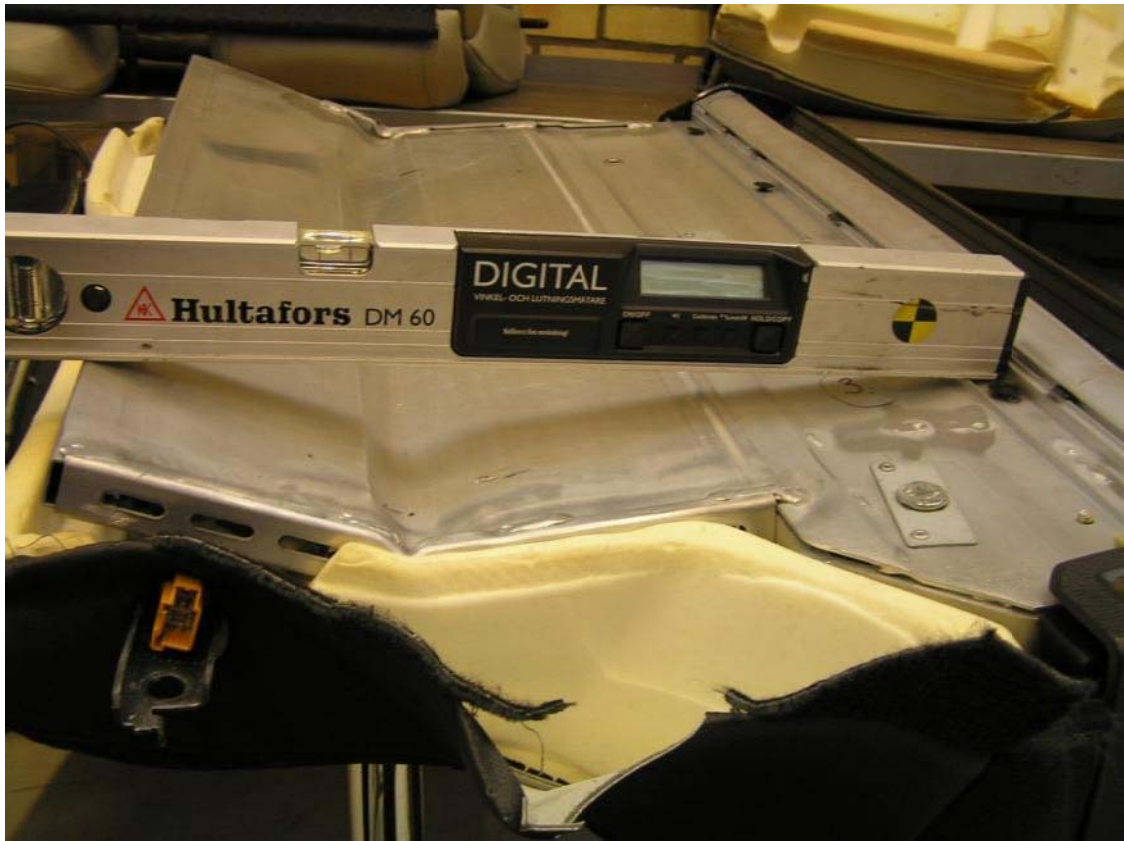
Bild 5, Mätning av den horisontella deformationen av sätesryggen