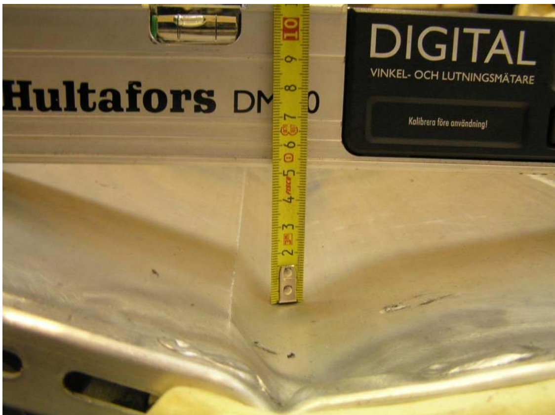
Bild 6, Mätning av den horisontella deformationen av sätesryggen