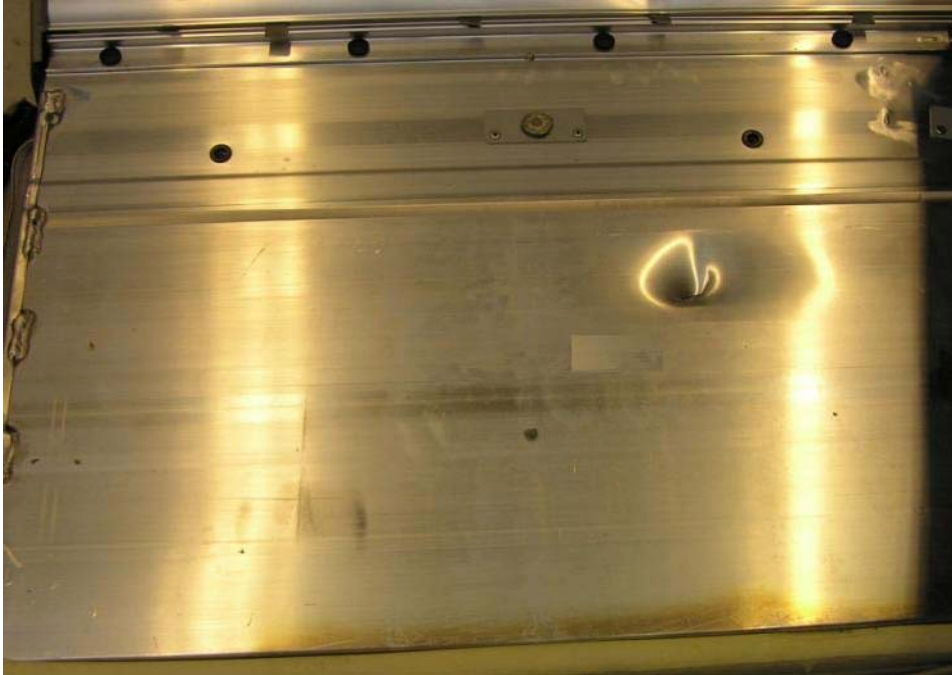
Bild 7, Penetrationshål efter prov