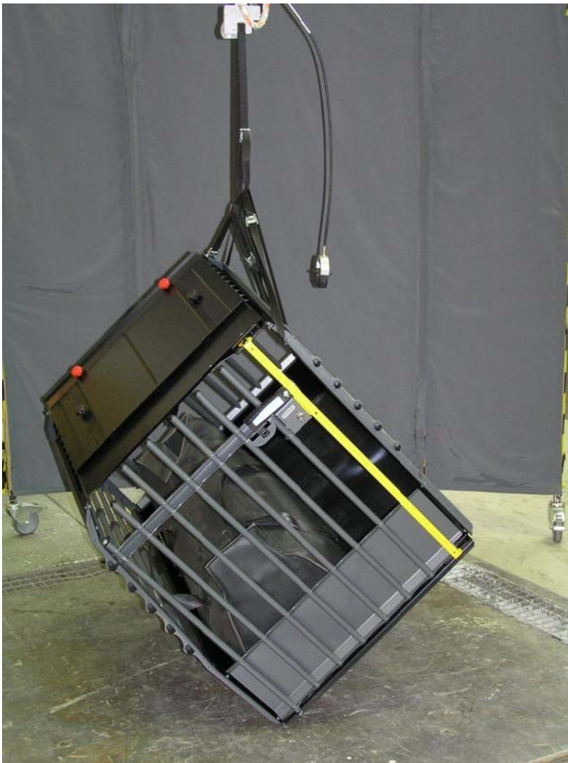
Bild 8, Vinkling av provobjekt innan fallprov