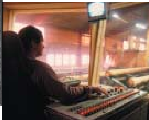
. . . eller bra flyt!