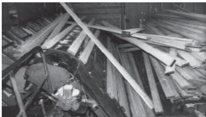
Ständiga stopp . . .