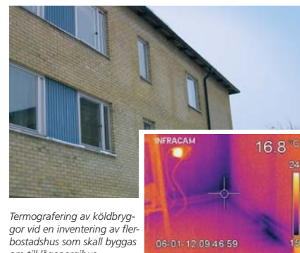
Termografering av köldbryggor vid en inventering av flerbostadshus som skall byggas om till lågenergihus.

Vid inventeringen inför en ombyggnad klarläggs vilka åtgärder som behöver genomföras. Vi kan på plats hjälpa till med en genomgång av faktorer som kan påverka inomhusmiljö och energianvändning. Exempel på det är sådana faktorer som fuktförhållanden, fuktackad material, riskkonstruktioner, fönstrens och klimatskärmens status, värmesystemets uppbyggnad, styr- och regleringssystemets funktion, lufttäthet, bullerproblem och radonförekomst.