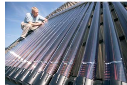
SP har lång erfarenhet av att tekniskt utvärdera solfångare i laboratoriemiljö och i fält.

Vi kan genom oberoende provning kontrollera att komponenter har förväntad prestanda. Detta är viktigt för byggnadsdelar som har höga krav på U-värden och lufttäthet men också för installationer som har höga krav på prestanda och tillförlitlighet.