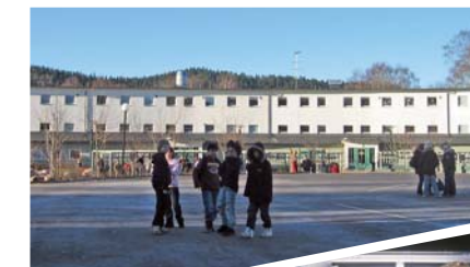
Sjöboscolan i Borås har en förvaltning som följer P-märkningsreglerna för inomhusmiljö och energianvändning.

För att den färdiga byggnaden skall behålla sin goda prestanda krävs kontinuerlig uppföljning i förvaltningen. Förvaltningen är därför en betydelsefull del i SPs kvalitetssäkringssystem för inomhusmiljö och energianvändning.